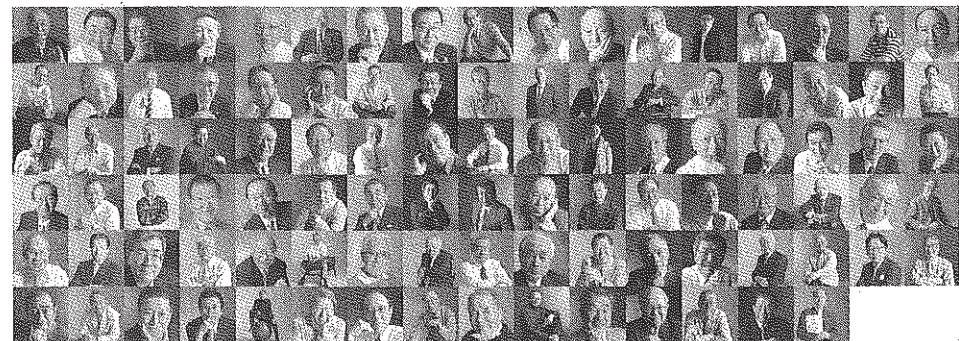
写真展「産業人魂」に登場する100人